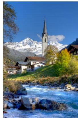
Silbertal im Montafon